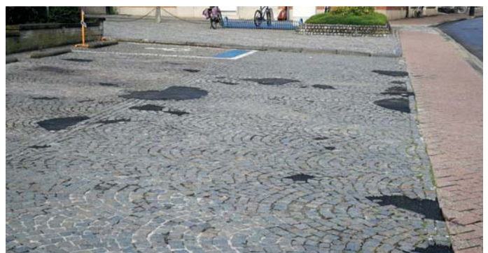
6 weken na de melding van losliggende stenen op de parking rond de kerk, werd het probleem "netjes" opgelost ... de stenen liggen niet meer los, want ze liggen er niet meer, maar mooi is anders ...

Daarnaast geloven we dat we het centrum kunnen doen heropleven door het tijdens de zomer op zondagnamiddag vanaf 14u autovrij te maken. Na de testfase koppelen we graag onze bevindingen terug naar de bevolking, om deze dan samen te evalueren. Ook na 14 oktober telt uw mening!