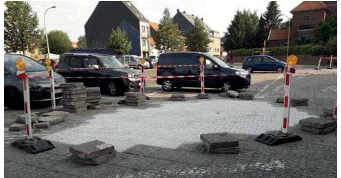
Dat het Mieregemplein tot op de draad versleten is, is een open deur intrappen. Herstellingswerken gebeuren onder het motto: "creatief met zand en beton".